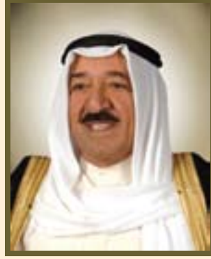
صاحب السمو الشيخ صباح الأحمد الجابر الصباح أمير دولة الكويت