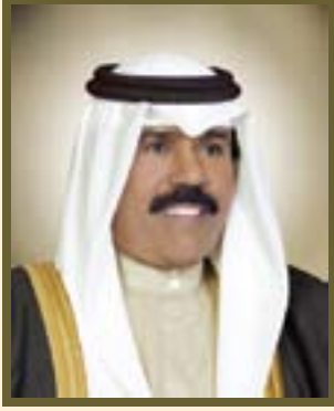
صاحب السمو الشيخ نواف الأحمد الجابر الصباح ولي عهد دولة الكويت